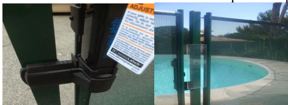
Plaque de plexiglas

Réglage de la serrure : La serrure doit toujours se trouver du côté de la piscine. Afin qu'un enfant ne puisse pas passer une main : l'espace laissé libre entre le cadre et le poteau du portillon au niveau du bouton levier ne doit pas être supérieur à 1.5cm. Il est possible au besoin, d'élargir l'espace en réglant la serrure. Il est aussi impératif de fixer la plaque de plexiglas (Platinum) ou les plaques de plexiglas ( Easy / Kitloc) à l'extérieur sur le poteau dans les trous prévus, en utilisant les vis fournies afin d'éviter une tentative d'ouverture par cet espace.